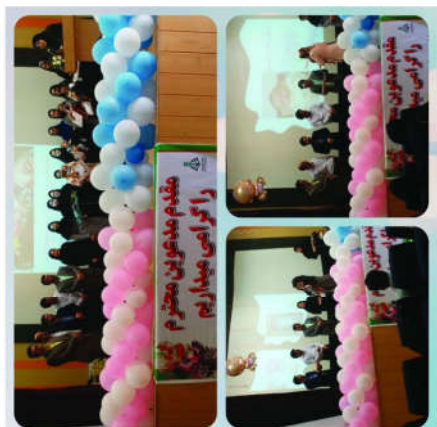
همه‌هنگی و برگزاری مراسمات و همایش‌ها