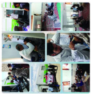
اطلاع رسانی اردوی جهادی کانون بسیج جامعه پزشکی دانشکده علوم پزشکی و خدمات بهداشتی درمانی اسدآباد