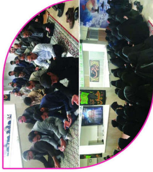
اطلاع رسانی اردوی جهادی کانون بسیج جامعه پزشکی دانشکده علوم پزشکی و خدمات بهداشتی درمانی اسدآباد