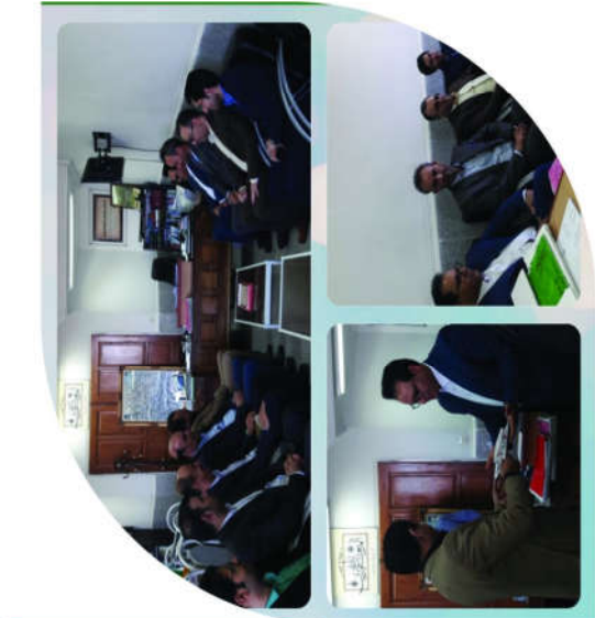
اطلاع رسانی گر امیداشت روز رادیولوژی و ایام مرتبط با دانشکده