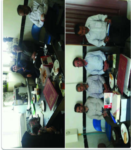
هماهنگی، برگزاری و حضور مستمر در جلسات مجمع خیرین سلامت شهرستان اسدآباد