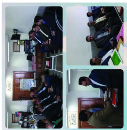
دیدار با روسای ادارات در ایام مربوطه و مرتبط