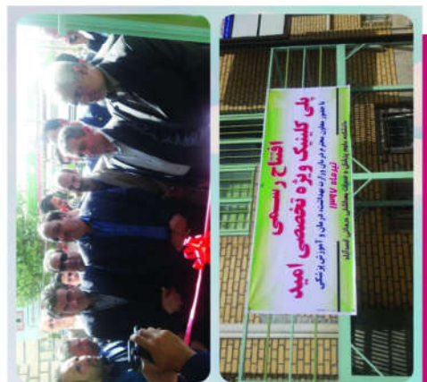
همه‌هنگی و برگزاری افتتاحیه‌ها