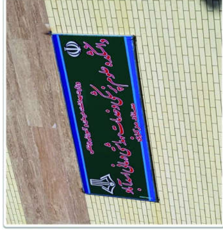
طراحی و ساخت تابلوهای جدید دانشکده در سطح شهر